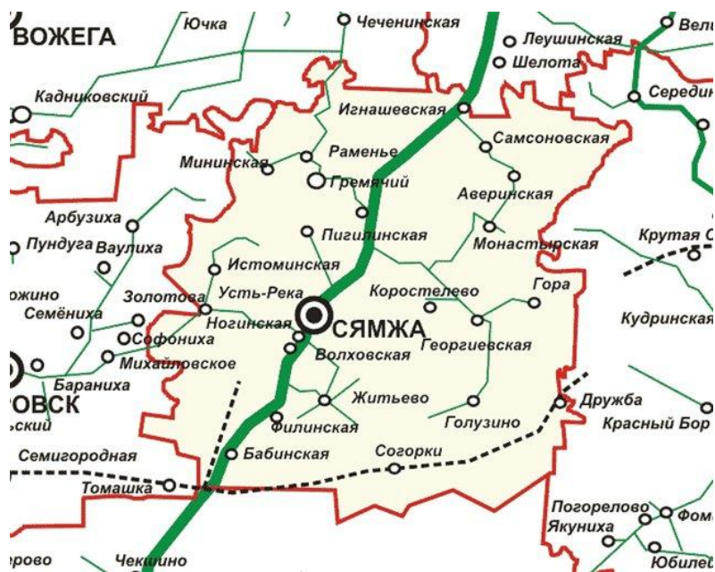
Рис. 3.1. Границы Сямженского административного района